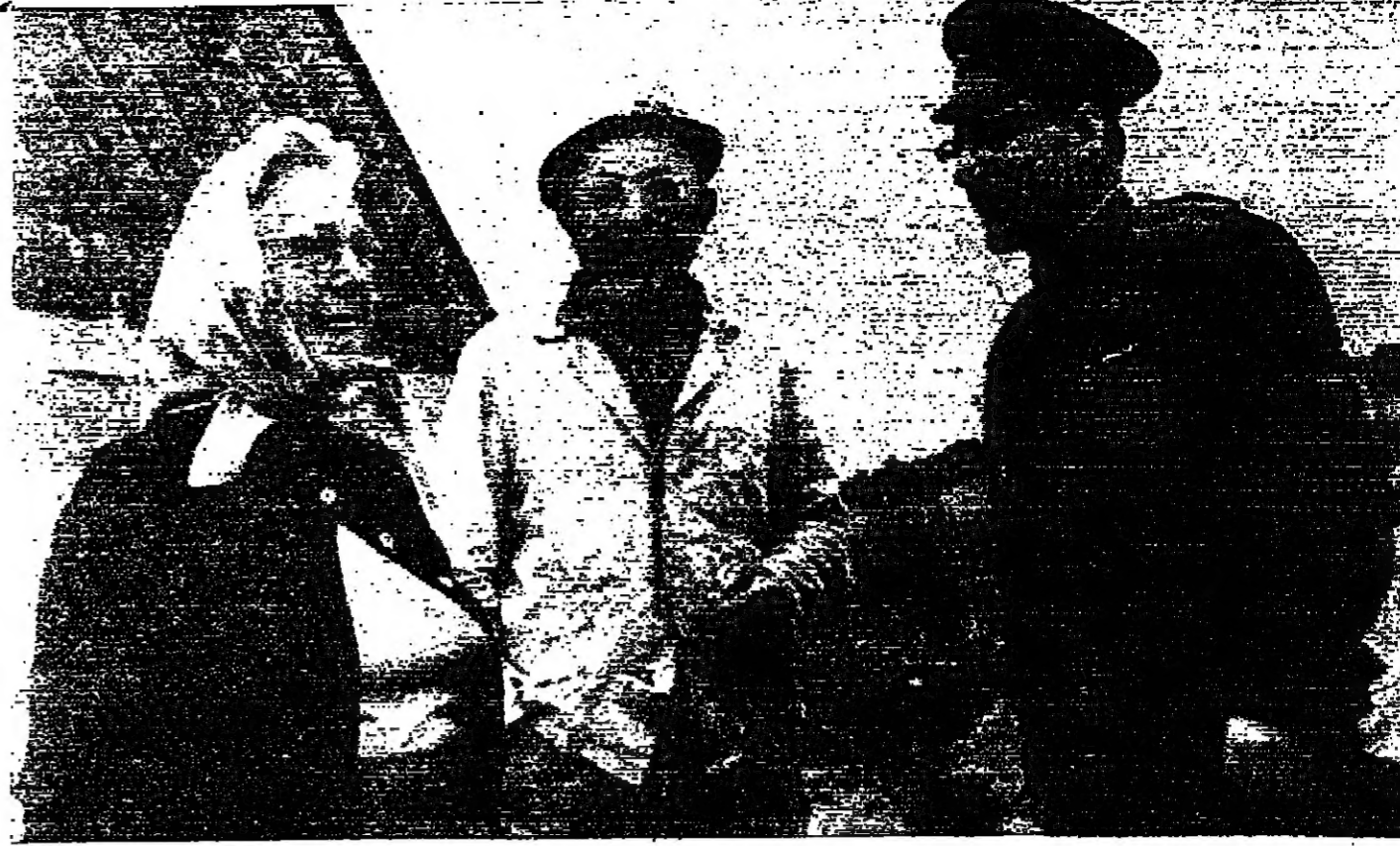
ملتك الحياة في تشيكوسلوفاكيا الرحلتها الطبيعية . وفي الصورة « خاصة بالنسور » احد الجنود الروس يتحدث الى مواطنين تشيكيين